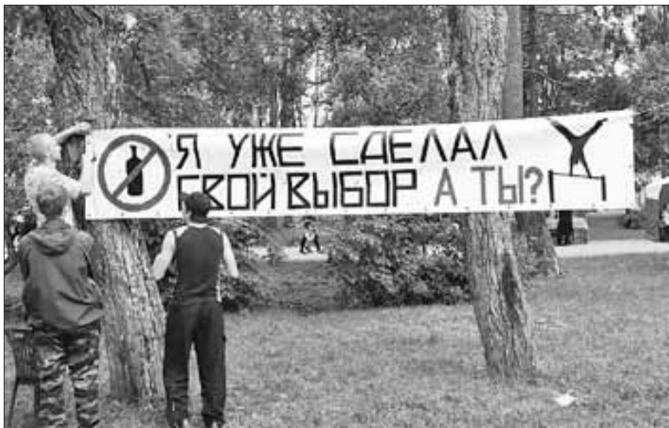
■ Способов борьбы с алкоголем в последнее время придумано много: так, молодежные объединения во время городских праздников размещают социальную рекламу.

Идет заливка площадок на ул. Капитана Хромцова, 5, у школы № 34 (ул. Клепача, 1), на ул. Пуштинского, 21. А всего планируется организовать 18 ледовых площадок во всех округах города.