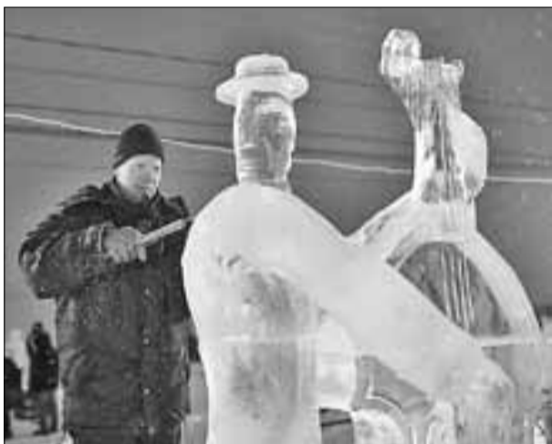
■ Мастера попытались воплотить музыкальную энергию в ледовую композицию «Музыкант».