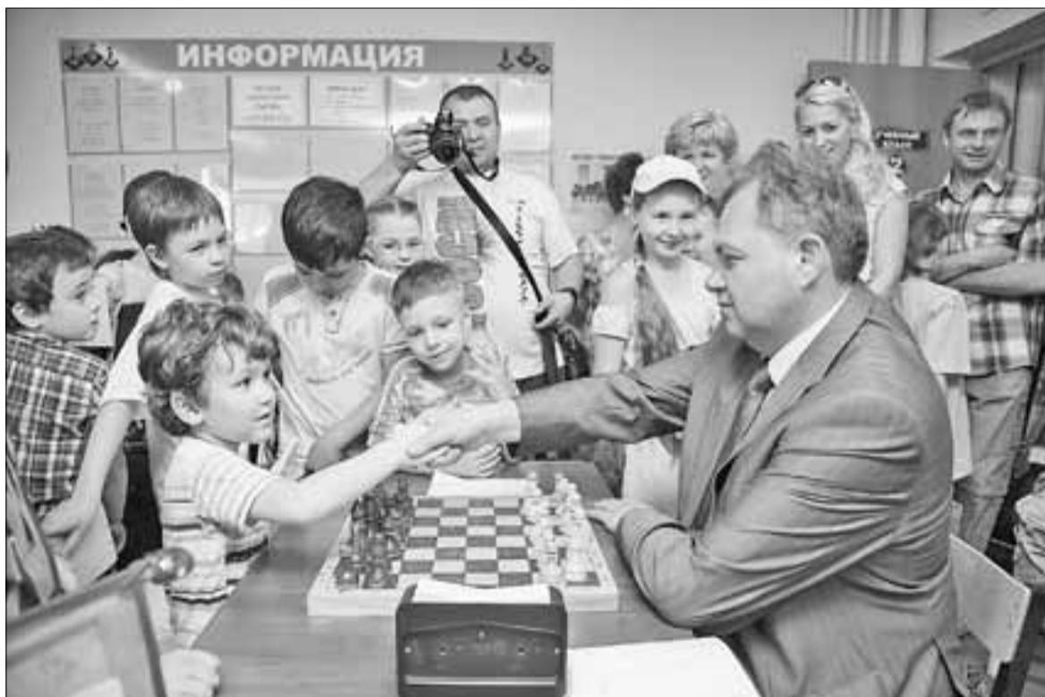
■ В ДЮСШ № 5 имени Я. Г. Карбасникова жизнь бьет ключом.

И если у нас в Архангельске есть отличные конькобежцы, то должна развиваться соответствующая школа. Регион реально может потянуть только одну команду высших спортивных достижений. Пусть это будет «Водник», тем более что у них уже есть школа, есть спортивные кадры, существуют спортивные объекты, где они занимаются. У нас есть спортивные результаты по плаванию. Значит, надо сосредоточиться на этом тоже. Надо понимать, что мы работаем на Россию. И пусть сейчас мы занимаем первичный участок: производим набор юных спортсменов, занимаемся первичным отбором, первичной подготовкой. Но от этого зависит спортивное будущее всей страны. Согласитесь, ведь олимпийские рекорды начинаются у нас, в спортивной провинции.