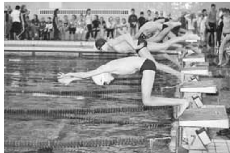
■ В Архангельске проходит более 400 спортивных мероприятий в год

– Разными видами спорта занимаются тысячи людей, а некоторыми из них – всего три-четыре энтузиаста. Но надо пони-