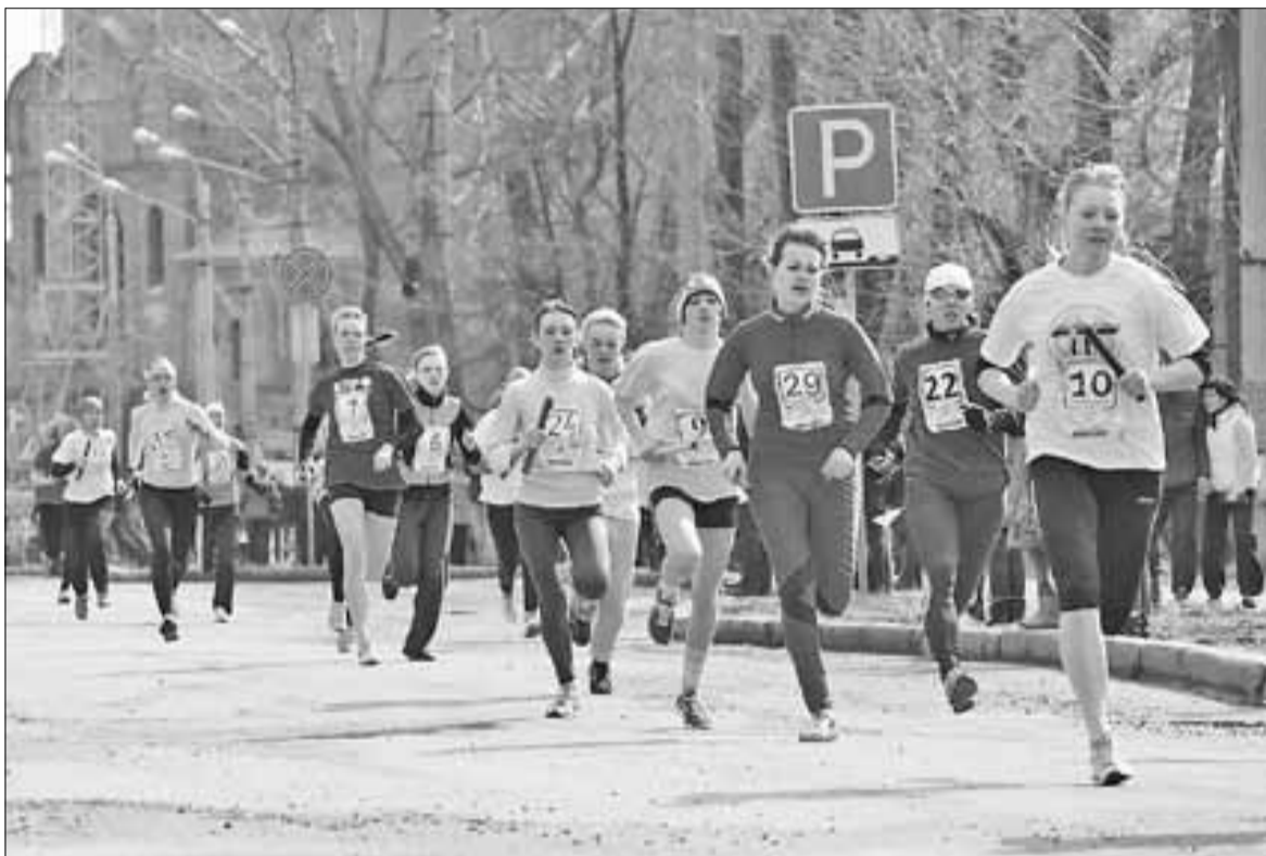
■ Традиционная Майская эстафета, которая проводится в канун 9 Мая, ожидаема и любима горожанами уже не один десяток лет.

ятий: первенств, чемпионатов, кубков, турниров по различным видам спорта, которые развиваются в областном центре. Хочу особо отметить, что мы проводим мероприятия самого разного масштаба: в них может принимать участие и четверо спортсменов, и пять-шесть тысяч человек, как, например, в «Лыжне России» и «Кроссе наций». Но в любом случае мы стараемся, чтобы все участники и зрители остались довольны.