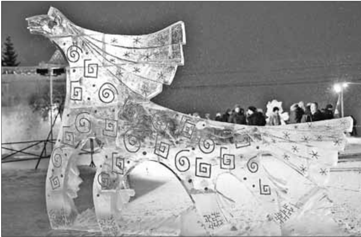
■ Лучшей признана ледовая композиция «Конь–огонь».

«Конь–огонь» из льда победил в конкурсе «Морожены песни»