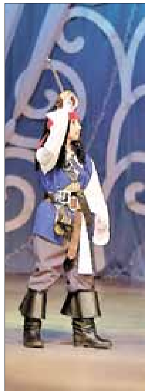
■ Семья Карельских