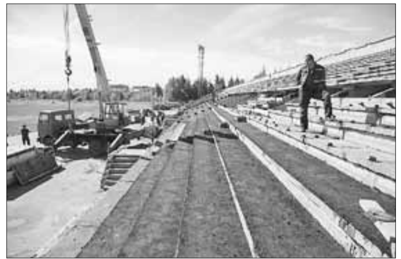
■ В Северном округе проводят масштабную реконструкцию стадиона

« Все 10 спортивных школ прекрасно отработали в 2013 году, выполнили свою программу. У нас ведь шесть тысяч человек – учащихся по 36 видам спорта. Есть удачные выступления на соревнованиях, большое количество ребят выполнили в 2013 году программу кандидатов в мастера спорта, появились и новые мастера спорта