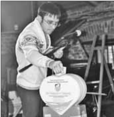
■ После аукциона многие ангелочки отправились в дома неравнодушных архангелогородцев, внесших свой вклад в общее доброе дело