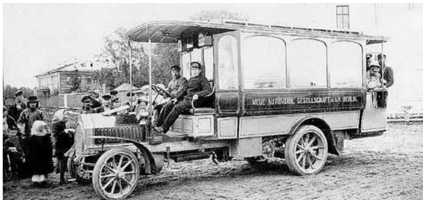
Первый автобус в Архангельске