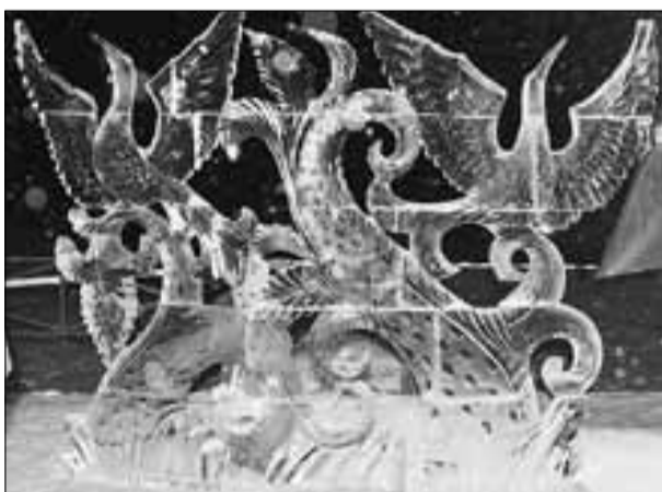
■ Скульптура «Замороженная песня».