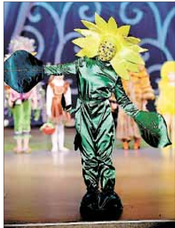
■ Диана Осадчая