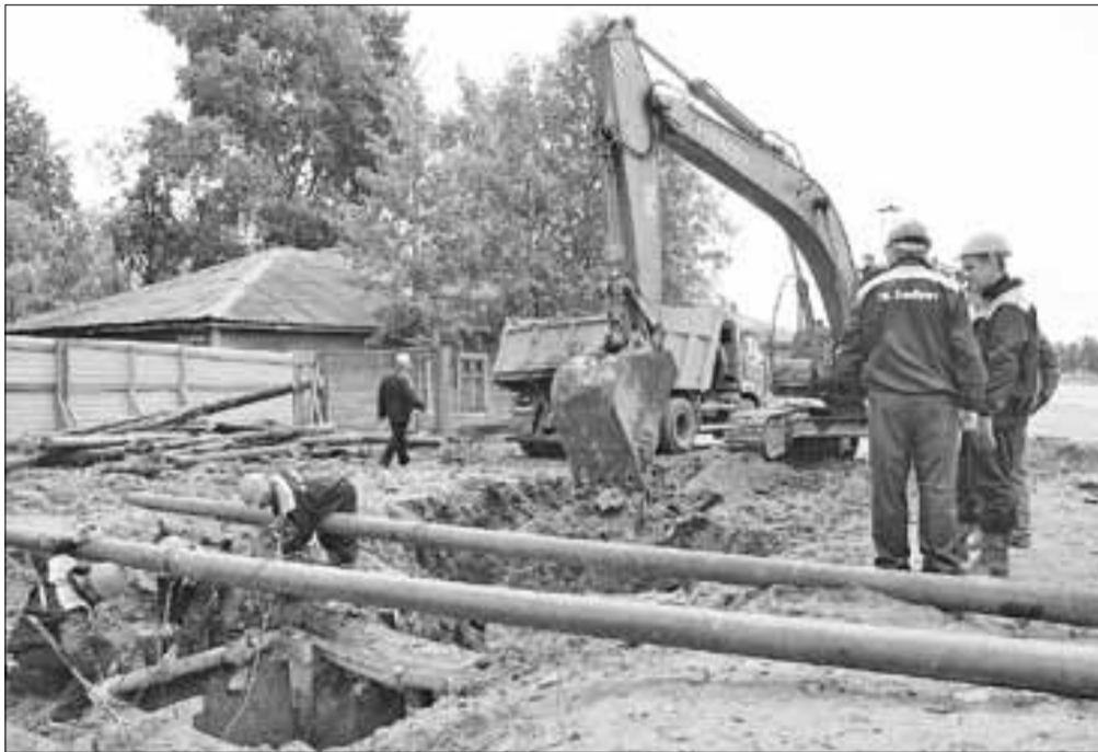
■ Строительство первой очереди кольцевого водовода в 2011 году

Пока «Водоканал» вынужден работать себе в убыток. Не при-